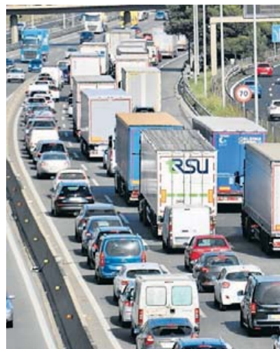
Una imatge de l'AP-7 a l'altura de Cerdanyola del Vallès.

La limitació arriba per procurar que hi hagi menys accidents, sobretot davant d'un mes de novembre