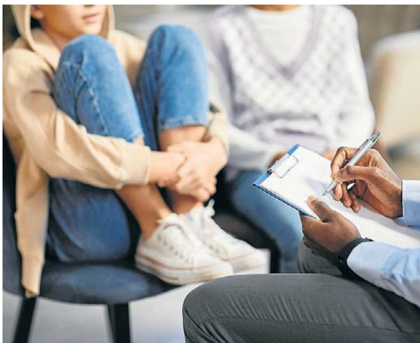
Un 30% dels joves viuen en risc de pobresa i exclusió.

programa d'acompanyament a través d'entitats sense ànim de lucre dotat amb gairebé 10 milions d'euros per atendre 20.000 joves, entre ells, uns 3.000 que pateixen problemàtiques de salut mental. Entre aquest últim grup de joves, la Generalitat es proposa, concretament, assolir un 5% d'inserció laboral.